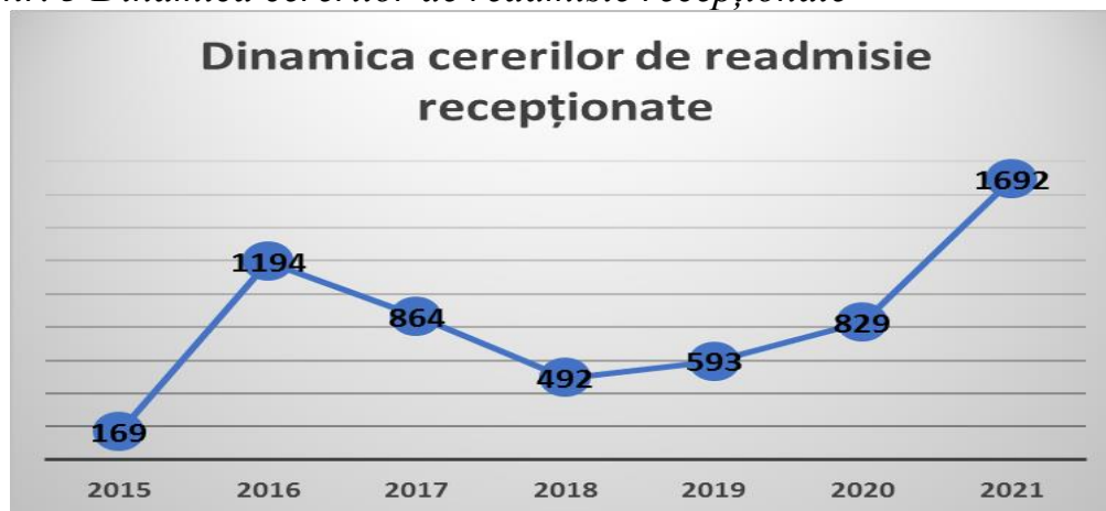
Figura nr. 3 Dinamica cererilor de readmisie recepționate

Negocierea și realizarea Acordurilor de Readmisie a majorat enorm volumul de lucru al angajaților Direcției, deoarece lipsește unitatea specializată în acest domeniu ( figura numărul 3 ).