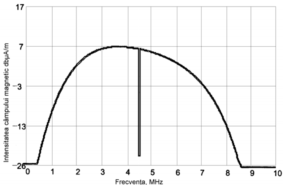
Figura 2: Limitele intensității câmpului magnetic pentru sensul de transmisiune Eurobuclă la Eurobaliză la 10 m distanță de măsurare